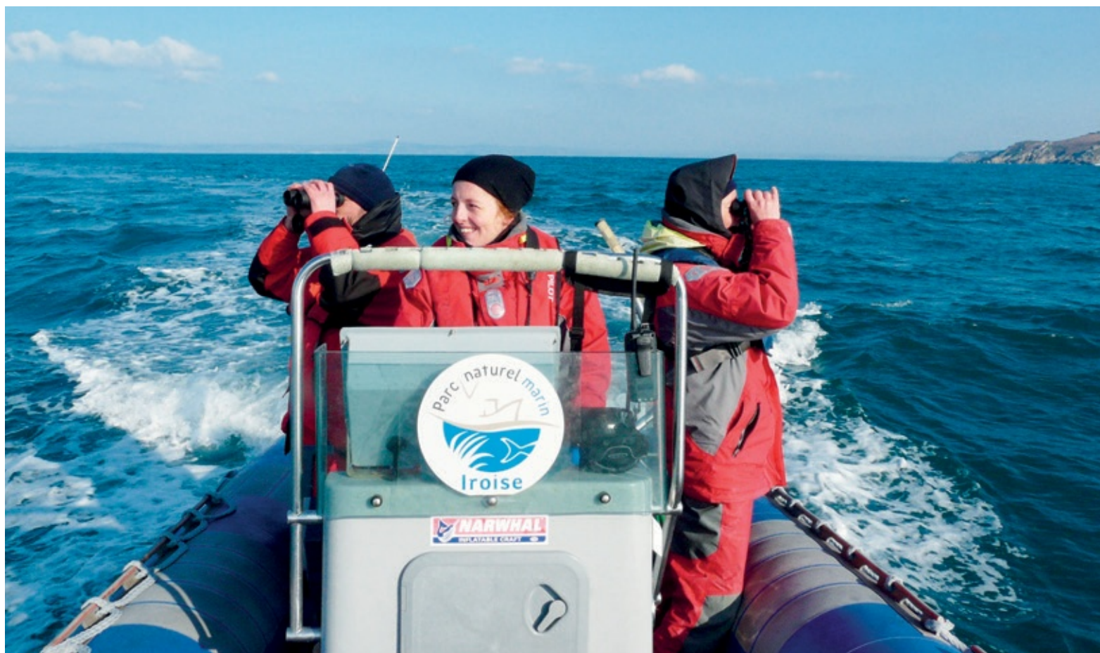
Suivi des oiseaux en baie de Douarnenez par l'équipe du Parc naturel marin d'Iroise.

Le premier parc naturel marin est né en Iroise en 2007. Aujourd'hui, ils sont neuf, et représentent 20 % de la surface des aires marines protégées françaises. Comment cet outil permet-il de concilier protection du milieu naturel et développement durable ?