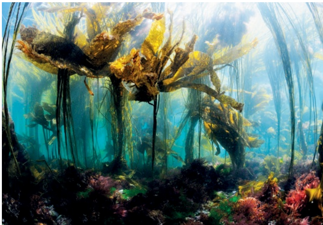
Le champ d'algues de Molène, le plus grand d'Europe, fait l'objet de suivis réguliers par les agents du parc.

Ainsi, une charte Natura 2000 des bonnes pratiques pour les prestataires de découverte du milieu marin