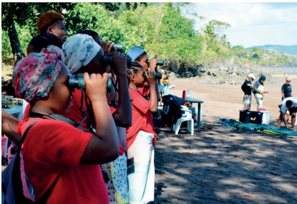
Jeu pédagogique sur les oiseaux marins, dans le cadre de la dernière opération « Premières bulles au pays du corail ».