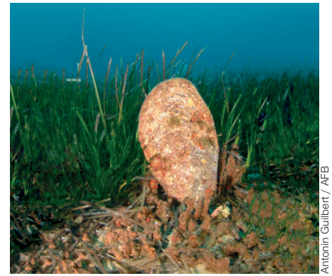
Grande nacre Pinna nobilis dans un herbier de posidonies Posidonia oceanica .