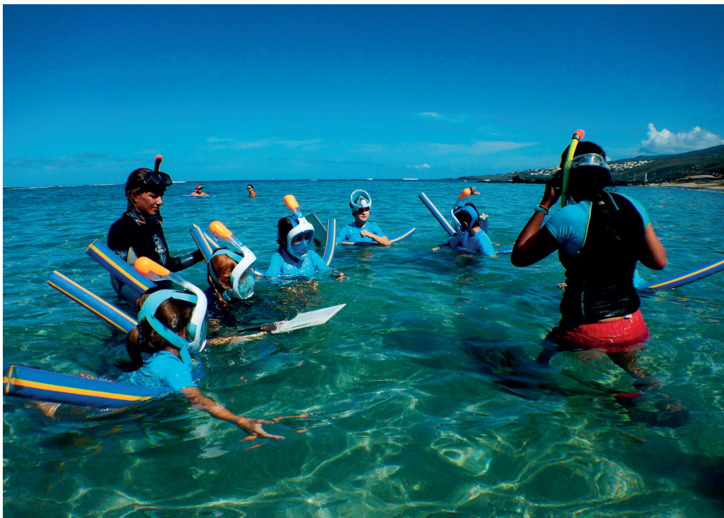
Découverte des fonds marins pour ces élèves de l'aire marine éducative de Saint-Leu.