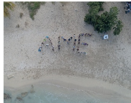
Séverine Bigmon / AFB

Au total, le réseau comptera 146 écoles en métropole et dans les Outre-mer à la rentrée scolaire 2019. « Connaître la mer » ; « Vivre la mer » et « Transmettre la mer » sont les trois axes structurants de ce label.