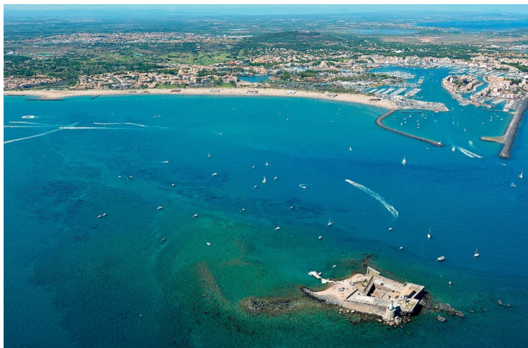
Zone de mouillage et d'équipements légers, une expérience pilote dans l'aire marine protégée de la côte agathoise (site Natura 2000), Méditerranée.

Les usagers seront mis à contribution. « La redvance permettra de couvrir la charge financière. En échange, des services seront proposés : réservation de l'amarrage en ligne, récupération de déchets, transport de passagers... Il y a un fondement écologique, mais pour les capitaines de ces grosses unités, c'est aussi un mouillage sécurisé. C'est un point sensible et on sent qu'ils sont réceptifs. »