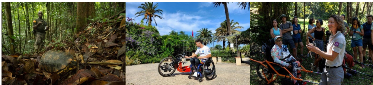
De gauche à droite : Inventaire naturaliste en Guyane ; Florian Jouanny teste un handbike à Porquerolles ; Sortie handinature dans les Ecrins

Télécharger la liste complète des projets 2024