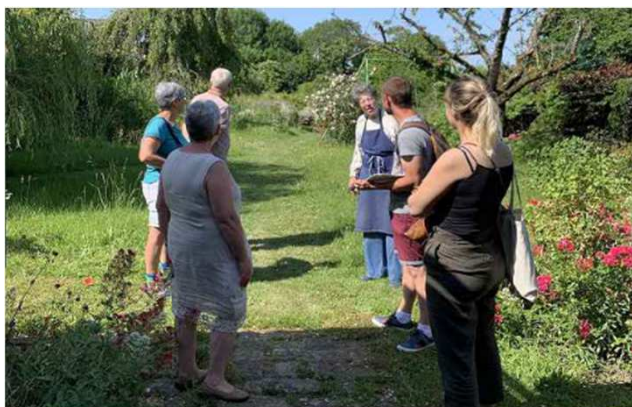
2022 : lancement du concours "Jardins sauvage" Portage : Commune Accompagnement Picardie Nature

Une dynamique de valorisation des pratiques favorisant la biodiversité au jardin devenue un véritable outil de mobilisation citoyenne