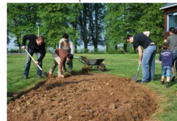
Elus et agents