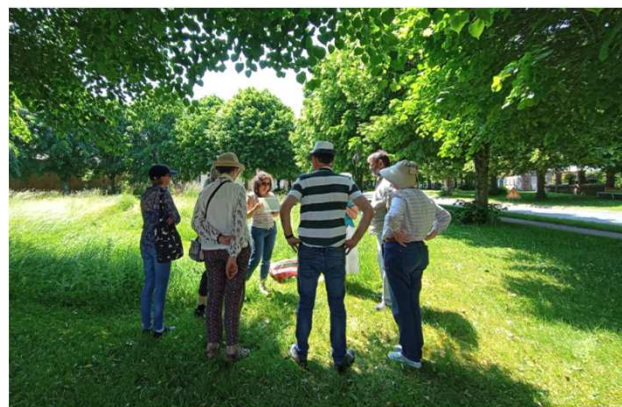
2023 : 2 ème édition Portage réseau des ambassadeurs de la biodiversité Accompagnement : Commune et Picardie Nature