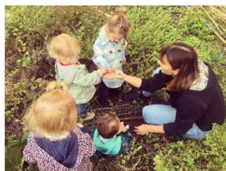
Temps des loisirs