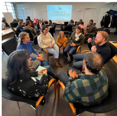
Concertation avec les acteurs de l'éducation à la nature

20 actions pour connaître, s'attacher et préserver la nature