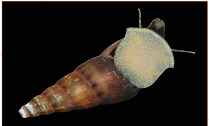
Melanoidea tuberculata – Mélanie tropicale