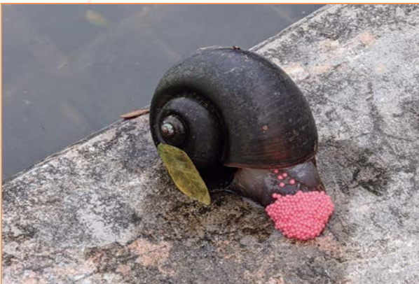
Pomacea canaliculata – Escargot pomme