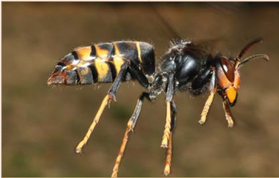
Vespa velutina nigrithorax – Frelon asiatique