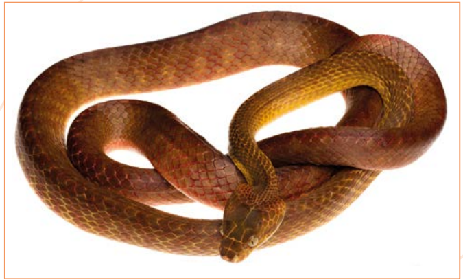
Pythonidae; Boiga irregularis