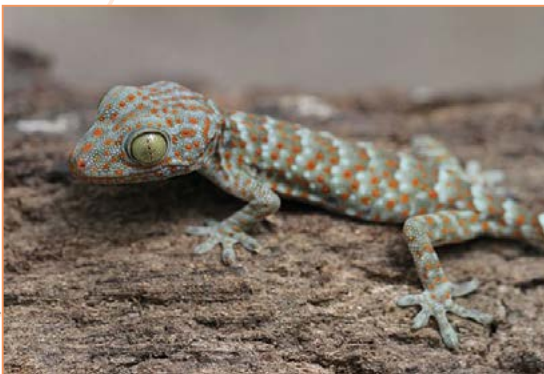
Gekkonidae; Gekko gecko – Gekko tokay