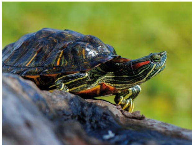
Tortue de Floride