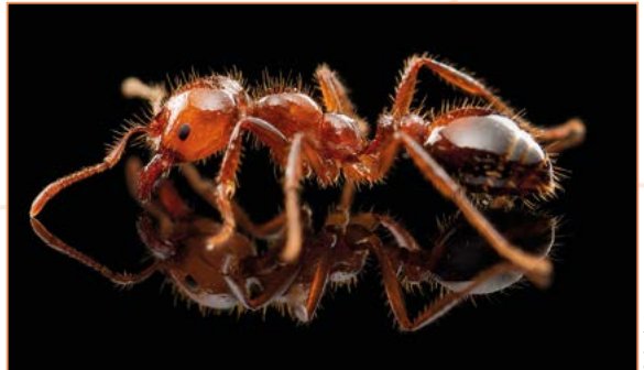
Solenopsis invicta – Fourmi de feu