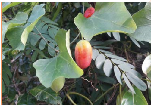
Epipremnum aureum – Pothos doré