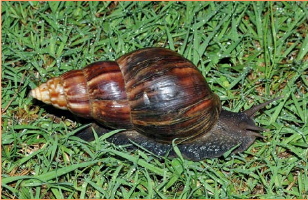
Lissachatina fulica – Achatine