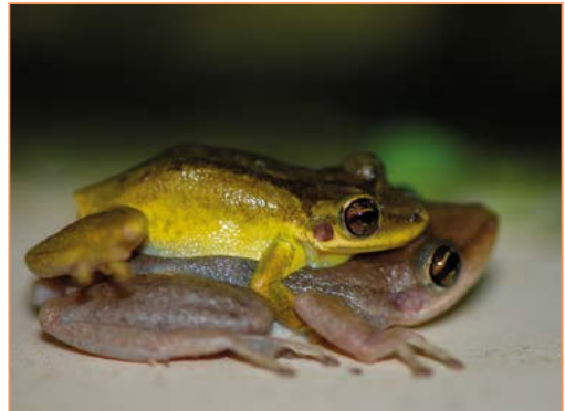
Eleutherodactylus johnstonei – Hylode de Johnstone