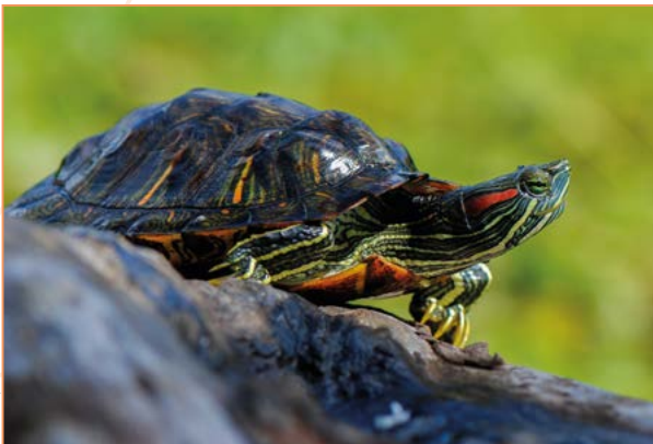
Emydidae; Trachemys scripta elegans – Tortue de Floride