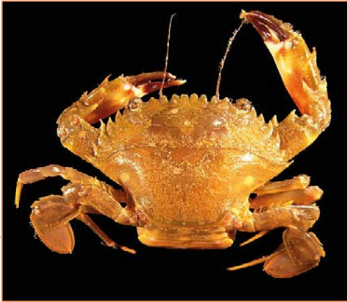
Charybdis hellerii – Crabe nageur à pinces épineuses