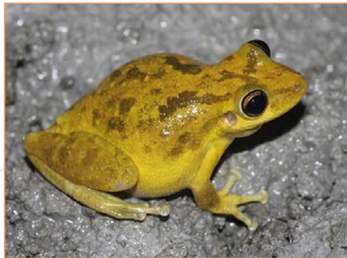
Hylidae ; Scinax ruber – Rainette des maisons (mâle et femelle)