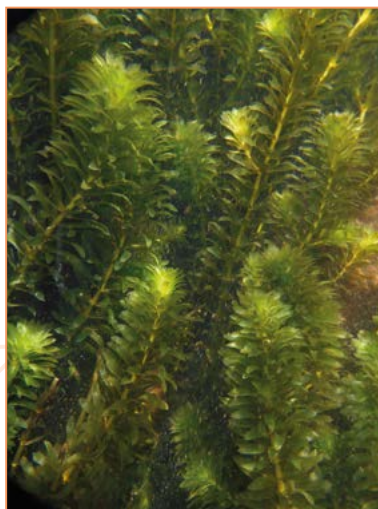
Hydrocharitaceae ; Hydrilla verticillata – Hydrille verticillée