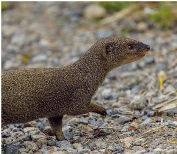
Petite mangouste indienne

Pour accompagner ce réseau d'acteurs, un centre de ressources spécifique a été mis en place par l'OFB et l'Union internationale pour la conservation de la nature (UICN): http://especes-exotiques-envahissantes.fr