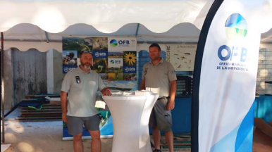
^ Sensibilisation à la biodiversité locale lors de la Fête de la Nature à La Beaume