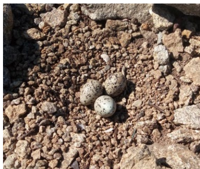
Nid d'huîtrier-pie

Cette reprise des activités de plein air sur les bords de mer coïncide avec la pleine saison de nidification d'oiseaux menacés comme les gravelots, les huîtriers-pie, les sternes ou encore les goélands. Ces espèces nichent à même le sol, sur des plages ou sur des îlots peu végétalisés, à l'abri des prédateurs terrestres (chiens, renards...), des dérangements et des coups de vent. Avec son linéaire de côte et ses nombreux îlots, la Bretagne joue un rôle majeur en France pour la nidification des oiseaux marins.