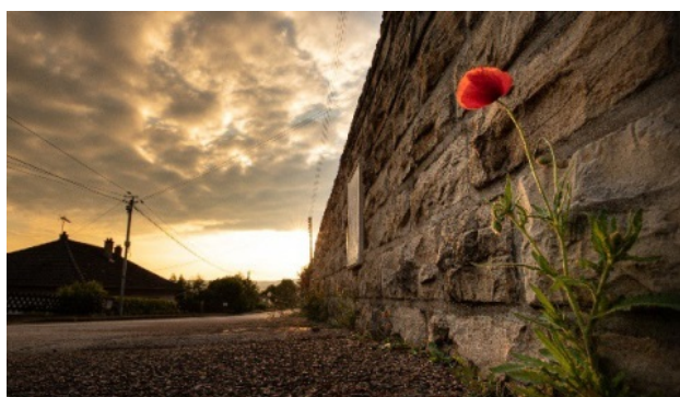
Coquelicot et bitume

Au début du printemps, la végétation redémarre après une période de mise en veille hivernale. De nombreux jardiniers amateurs sont alors tentés de se débarrasser des « mauvaises herbes » pourtant si précieuses à la biodiversité. Or, depuis le 1er janvier 2019, les particuliers ne peuvent plus acheter, stocker ou utiliser de produits phytopharmaceutiques « de synthèse » pour traiter ou désherber leurs jardins, allées, trottoirs, etc.