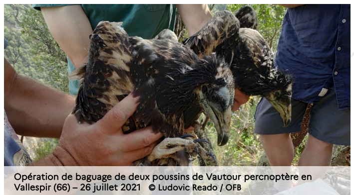
Opération de baguage de deux poussins de Vautour percnoptère en Vallespir (66) – 26 juillet 2021

Les agents des réserves naturelles, de l'OFB et les bénévoles d'associations naturalistes suivent avec la plus grande attention le succès de reproduction des couples présents dans les Pyrénées-Orientales. Cette journée dédiée au marquage des poussins a permis de les individualiser et d'évaluer leur état de santé.