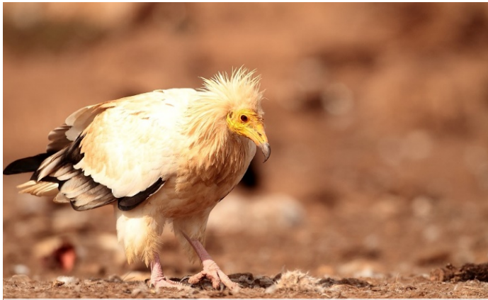
Percnoptère d'Égypte adulte

En Vallespir, lundi 26 juillet 2021, dans le cadre d'un programme de suivi et du Plan National d'Action (PNA) en faveur du Vautour percnoptère Neophron percnopterus , une opération de baguage de deux poussins a été réalisée.