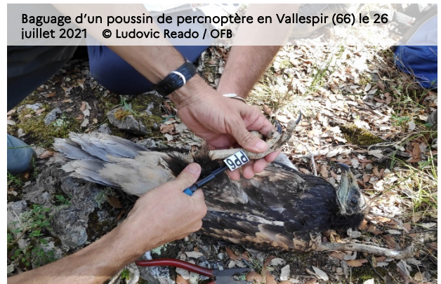
Baguage d'un poussin de percnoptère en Vallespir (66) le 26 juillet 2021