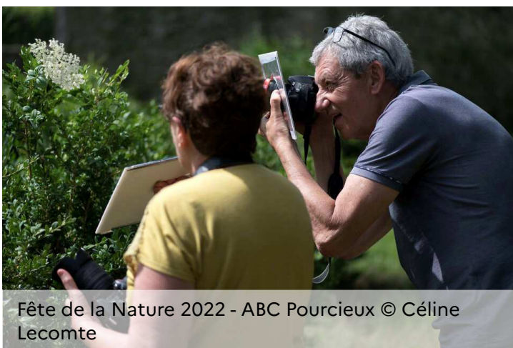
Fête de la Nature 2022 - ABC Pourcieux

En janvier dernier, l'OFB lançait le 8 e appel à projets dédié au soutien des collectivités pour la réalisation de leur Atlas de la biodiversité communale (ABC), afin d'entretenir et de développer la dynamique lancée en 2017.