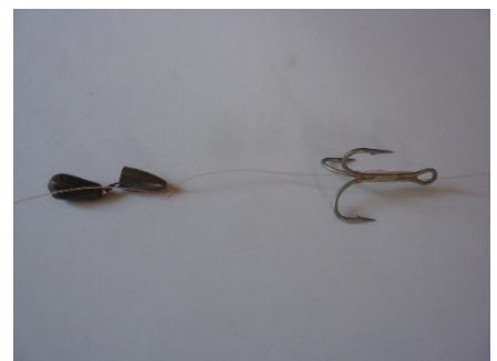
Matériel appréhendé : grappins (engin prohibé)

La technique du grappin attache le poisson par le ventre ou le dos et provoque de graves lésions sur les corps des différents poissons.