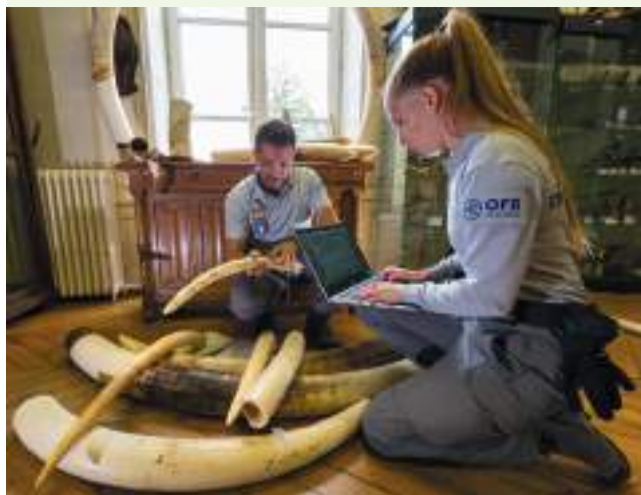
Des inspecteurs de l'environnement réalisent un inventaire de pièces en ivoire

Les modalités d'articulation entre l'OFB et les services déconcentrés de l'État, qui ne peut se réduire à une simple répartition des rôles entre police administrative et police judiciaire, doivent reposer sur une relation constante alimentée par des informations mutuelles régulières et le respect des priorités définies par les préfets dans les plans de contrôle départementaux et de la convention conclue avec le ministère de l'Intérieur pour la période 2026-2030.