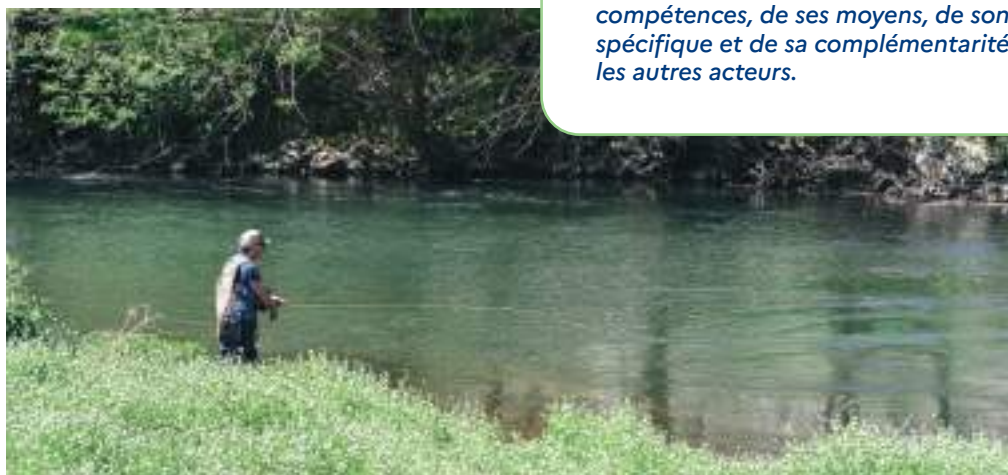
Pêcheur à la mouche sur les rives du Célé

Sur l'horizon du COP, l'OFB priorisera ses actions et ses interventions financières pour atteindre, dans le cadre des missions qui lui sont fixées, la meilleure contribution possible à la transition écologique au regard de ses compétences, de ses moyens, de son apport spécifique et de sa complémentarité avec les autres acteurs.