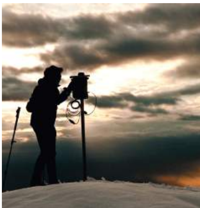
Instrument de recherche pour détecter des lagopèdes alpins