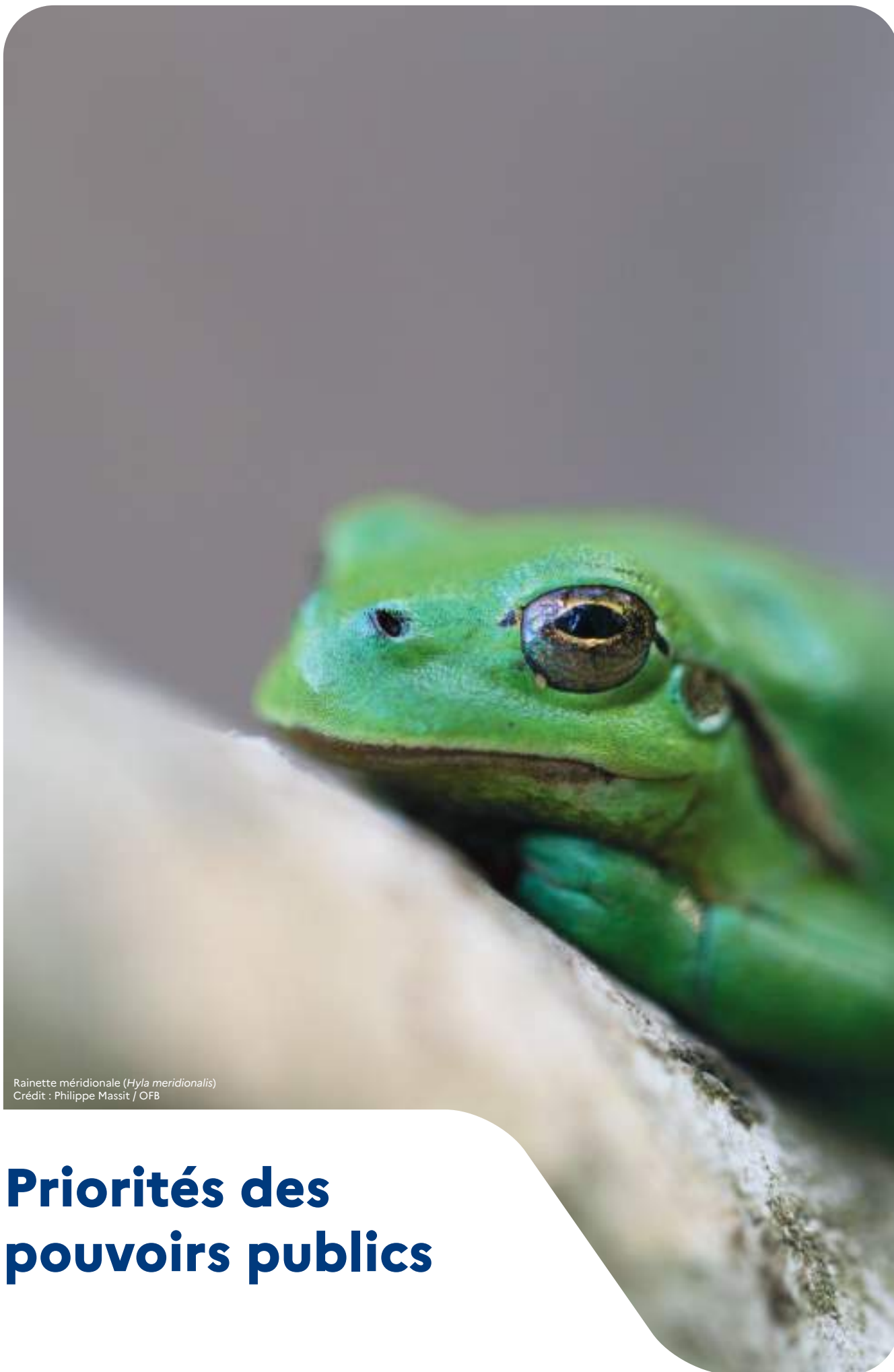
Rainette méridionale ( Hyla meridionalis )