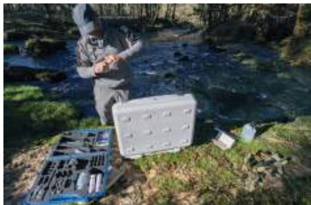
Agent réalisant des mesures physico-chimiques

Le concours attendu de l'Office pour assurer la formation permettant le commissionnement de l'ensemble des inspecteurs de l'environnement est également réaffirmé.