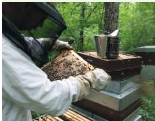
Les Ruchers du Fourneau (Esprit Parc National, Parc national de forêts)

L'OFB accompagne la montée en compétence des gestionnaires sur l'évaluation de l'efficacité de la gestion, en poursuivant la dynamique entre les 3 familles de parcs. Dans le cadre du LIFE BIODIV'FRANCE, un système d'information sur les aires protégées est lancé, et un tableau de bord des aires marines protégées est élaboré à l'échelle des façades maritimes.