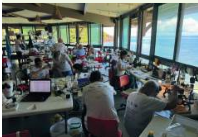
Mission d'exploration scientifique - La Planète revisitée des îles de Guadeloupe

Il contribue aux préfigurations des ARB, accompagne les ARB installées et favorise les synergies entre les ARB ultramarines. Il accompagne la mise en œuvre des directives européennes (principalement la DCE, la DERU et la directive eau potable) dans les DROM et les feuilles de route dans les COM. Il appuie la diplomatie environnementale française à travers des coopérations transfrontalières et partenariats régionaux incluant les territoires ultramarins.