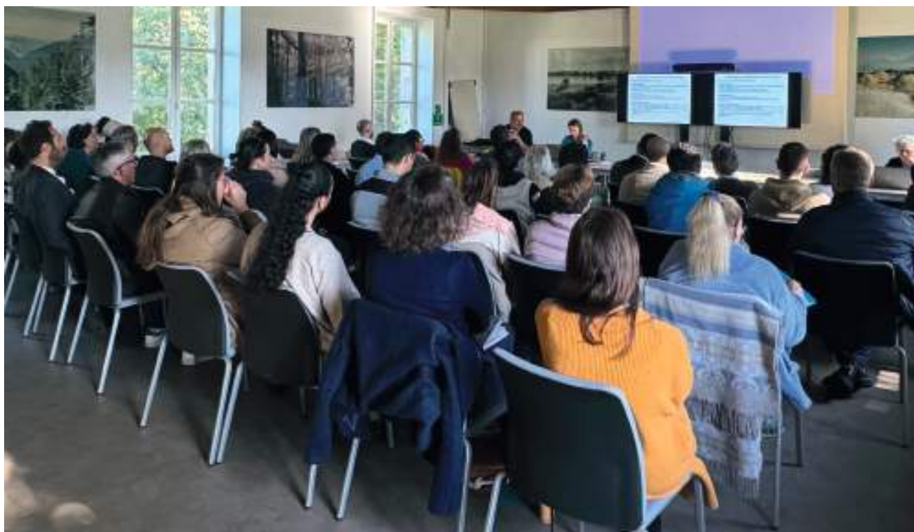
Réunion de la direction des finances sur le site national de Saint-Benoît

Dans le cadre du renouvellement de son SPSI, l'OFB vise à poursuivre l' optimisation de ses implantations immobilières , dans un souci de rationalisation du fonctionnement interne, tout en maintenant un équilibre entre présence territoriale et rationalisation du parc immobilier.