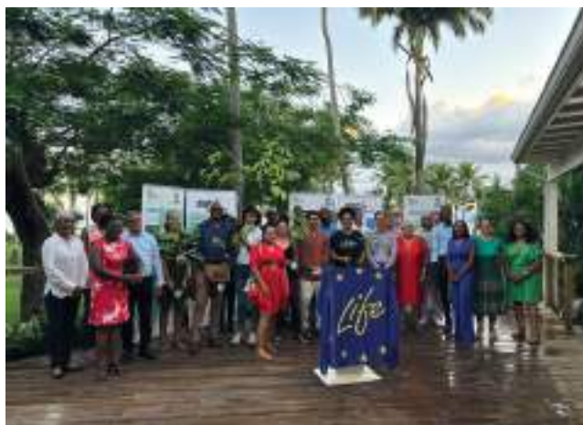
Programme européen BESTLIFE2030

Dans le même souci d'efficacité et d'efficacités, mais aussi pour démultiplier son action, l'établissement poursuivra l'accompagnement des partenaires dans le cadre du montage commun de projets européens (ex. gestionnaires d'aires protégées).