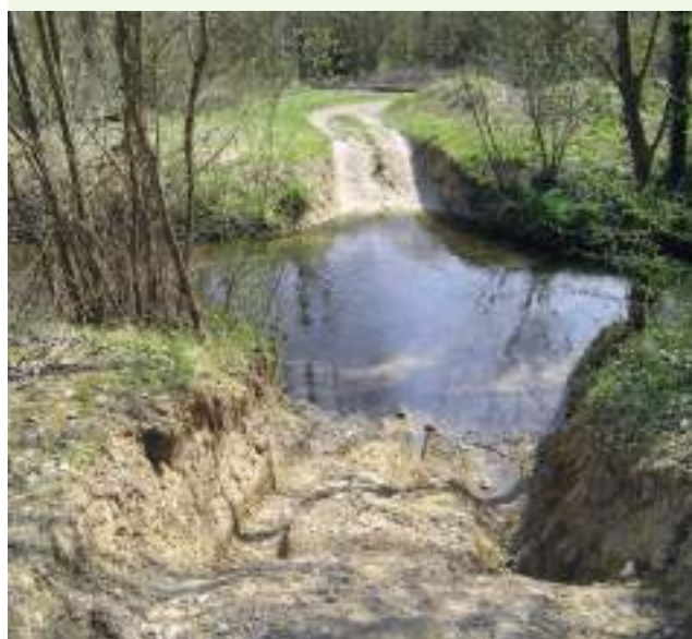
Passage de 4x4 et quads dans une rivière

Créées pour préserver un patrimoine naturel remarquable, les aires protégées contribuent à la bonne qualité écologique des milieux et des territoires qui les entourent, et participent au maintien des services que les écosystèmes assurent aux populations. Parce qu'ils abritent une riche biodiversité, mais aussi pour leurs fragilités et les pressions qu'ils subissent, certains espaces naturels bénéficient de règles de protection plus fortes qu'ailleurs. Aux fins de veiller à leur bonne application et pour donner du sens à ces règles de protection l'OFB priorisera une partie de ses missions de police dans ces espaces protégés, à terre comme en mer (notamment dans les zones de protection forte), en complémentarité des actions de police des gestionnaires d'aires protégées, comme le prévoit la stratégie nationale de contrôle.