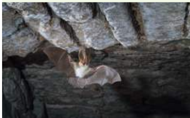
Oreillard en vol

Mise en œuvre du protocole d'observation des étiages estivaux ( https://onde.eaufrance.fr/ ). Les données ONDE, ainsi que certains faits marquants concernant les impacts du manque d'eau sur les milieux aquatiques et sa biodiversité en période estivale (mortalité d'espèces, prolifération d'espèces exotiques envahissantes ou de cyanobactéries), sont présentés par les agents de l'OFB lors des comités « ressources en eau » (CRE) et des Comités d'Anticipation et de Suivi Hydrologique (CASH).