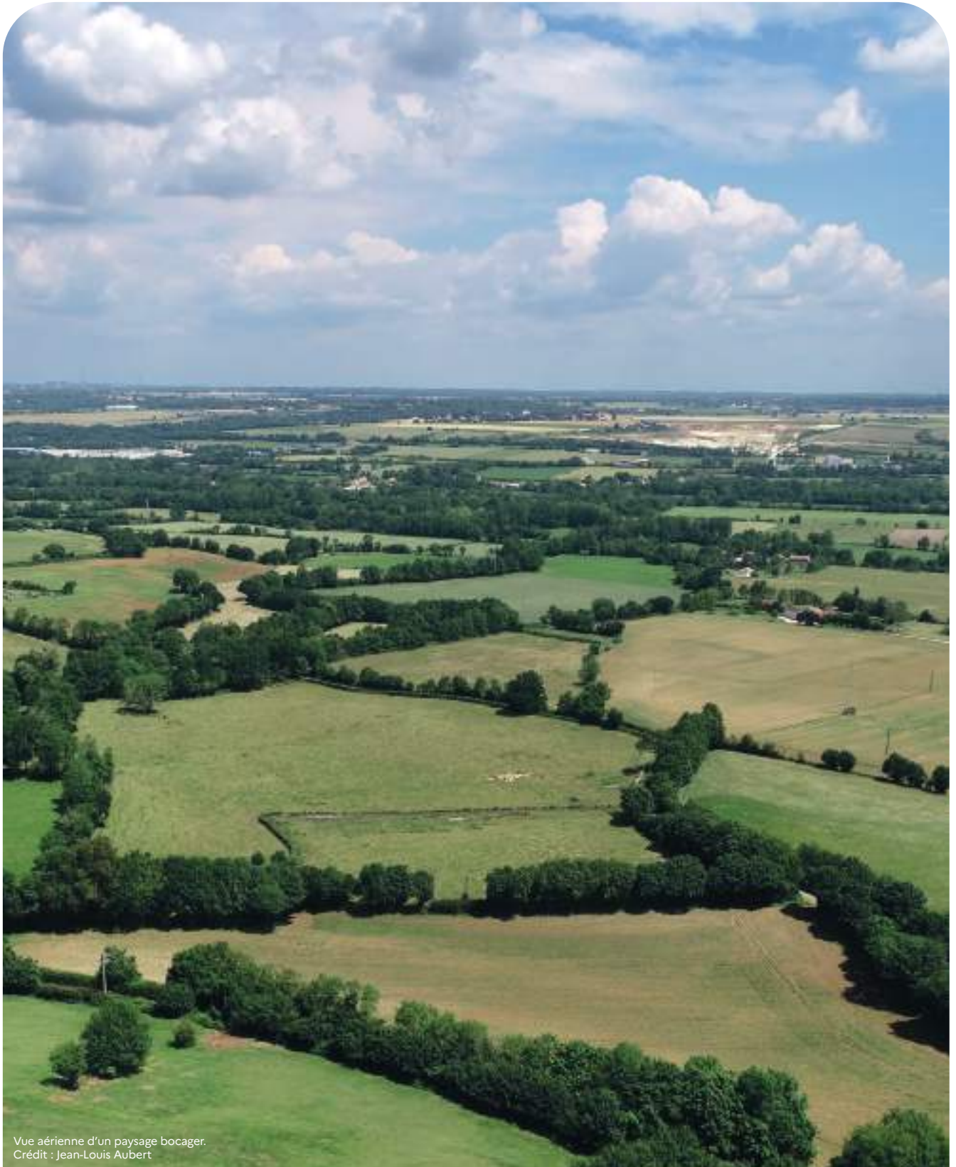
Vue aérienne d'un paysage bocager.