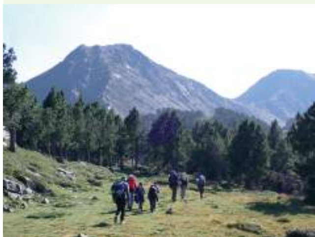
Randonnée dans le massif des Pérics

Les sports de nature ont un rôle transformateur dans l'engagement et la mobilisation citoyenne mais peuvent engendrer des pressions sur la biodiversité. Un pilier du projet LIFE BIODIV'FRANCE vise à placer le respect de la biodiversité au cœur des pratiques sportives. Il s'agit d'accompagner les acteurs des sports de nature (fédérations sportives et entités affiliées, entreprises de l'outdoor, organismes de formation, gestionnaires, etc.) dans des engagements concrets pour faire évoluer les comportements des professionnels, bénévoles et pratiquants de sports de nature, et de renforcer ainsi la communauté des citoyens impliqués dans la préservation de la biodiversité.