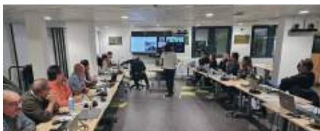
Séminaire des conseillers de prévention à Vincennes

L'enjeu est bien, dans ce cadre, de faire en sorte que les agents partagent une vision commune du sens, des priorités et des modalités d'exercice de leurs missions grâce notamment à une formation et un accompagnement adéquat, une programmation et une communication interne structurée.