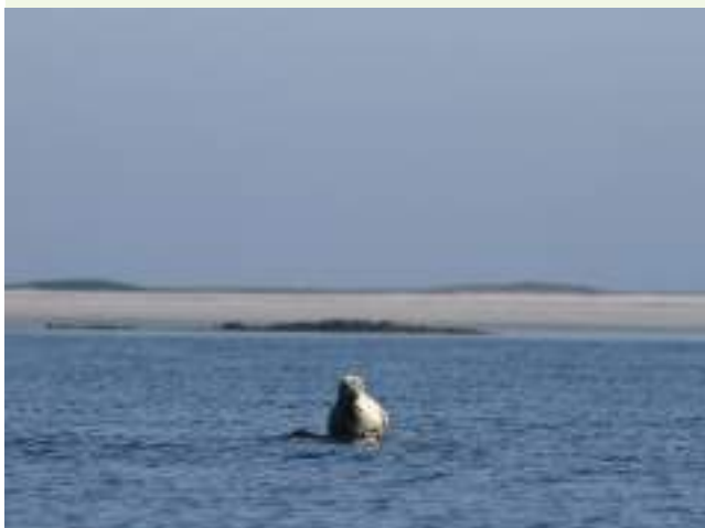
Femelle de phoque gris ( Halichoerus grypus ) devant l'île de Béniguet

L'OFB se donne comme objectif prioritaire de renforcer la protection dans ses aires protégées, en proposant des réglementations et des solutions ambitieuses permettant de lever ou limiter fortement les pressions sur les zones à enjeux, en lien avec les co-gestionnaires le cas échéant. Ces propositions s'appuient sur un travail approfondi de concertation et de pédagogie. Elles peuvent venir compléter les zones proposées en l'état à la reconnaissance en protection forte, afin de contribuer significativement aux objectifs fixés par le gouvernement.