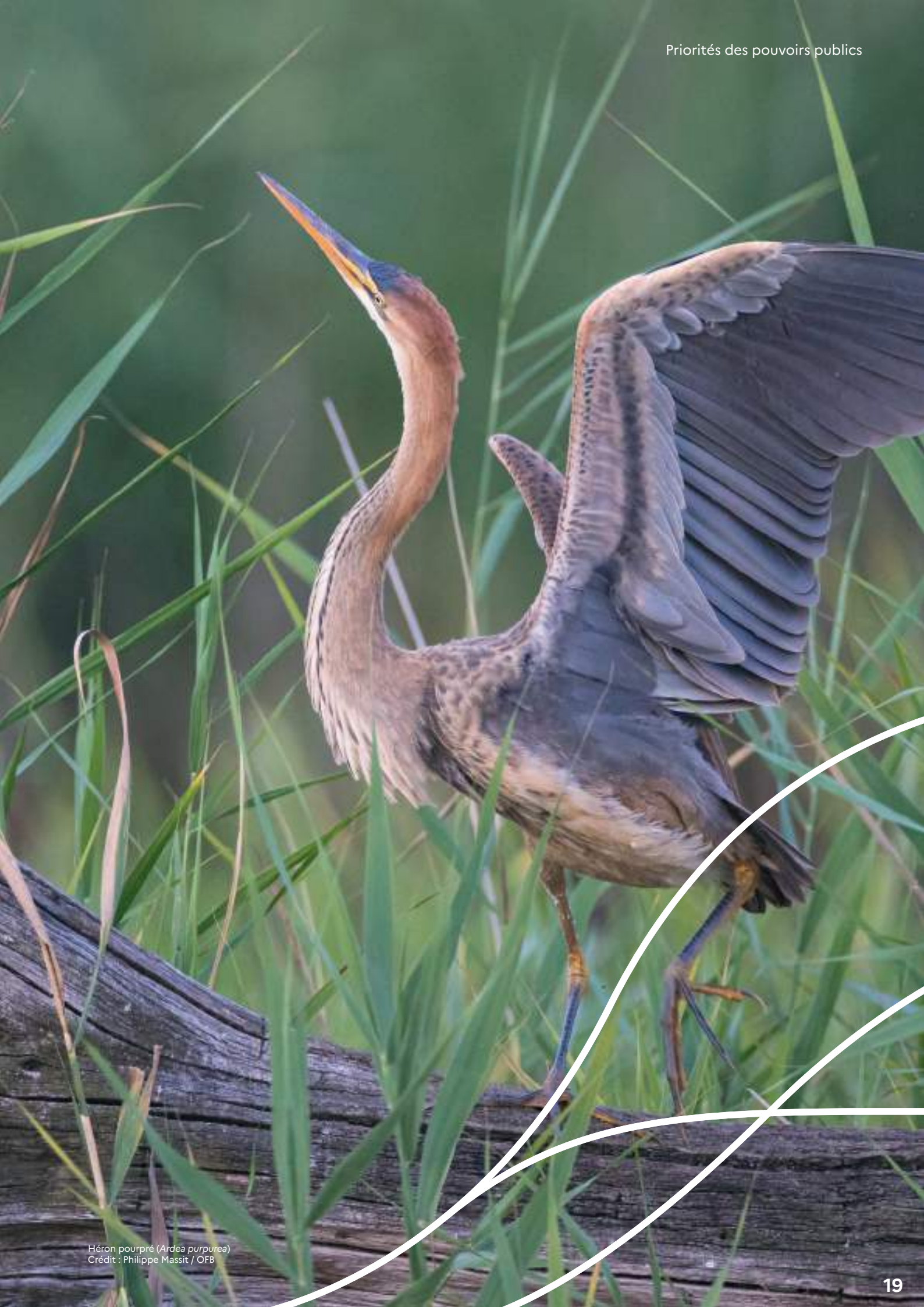
Héron pourpré ( Ardea purpurea )