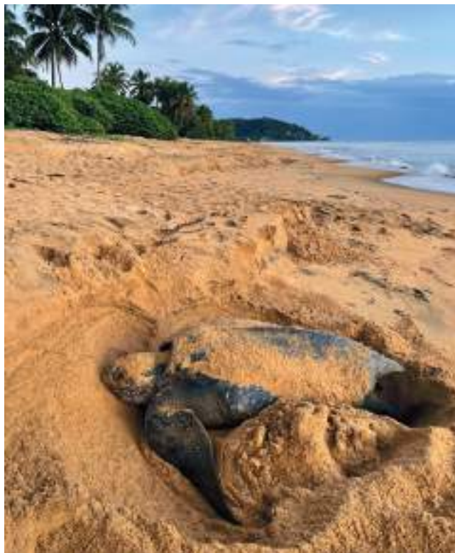
Tortue Luth ( Dermochelys coriacea ) en Guyane