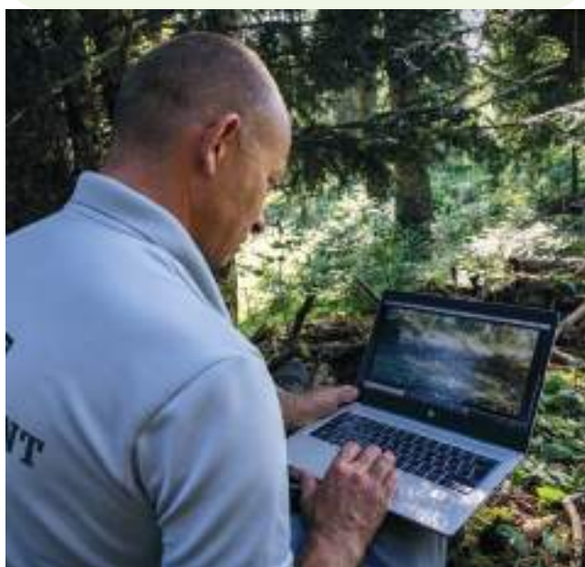
Relève d'un piège photo dans le cadre d'un suivi Lynx

Enfin, en cohérence avec les démarches interministérielles engagées en ce sens, l'OFB s'attachera à améliorer la mise en visibilité de ces données en développant une approche « client », fondée sur la mesure de l'audience et de la satisfaction des attentes des parties prenantes.