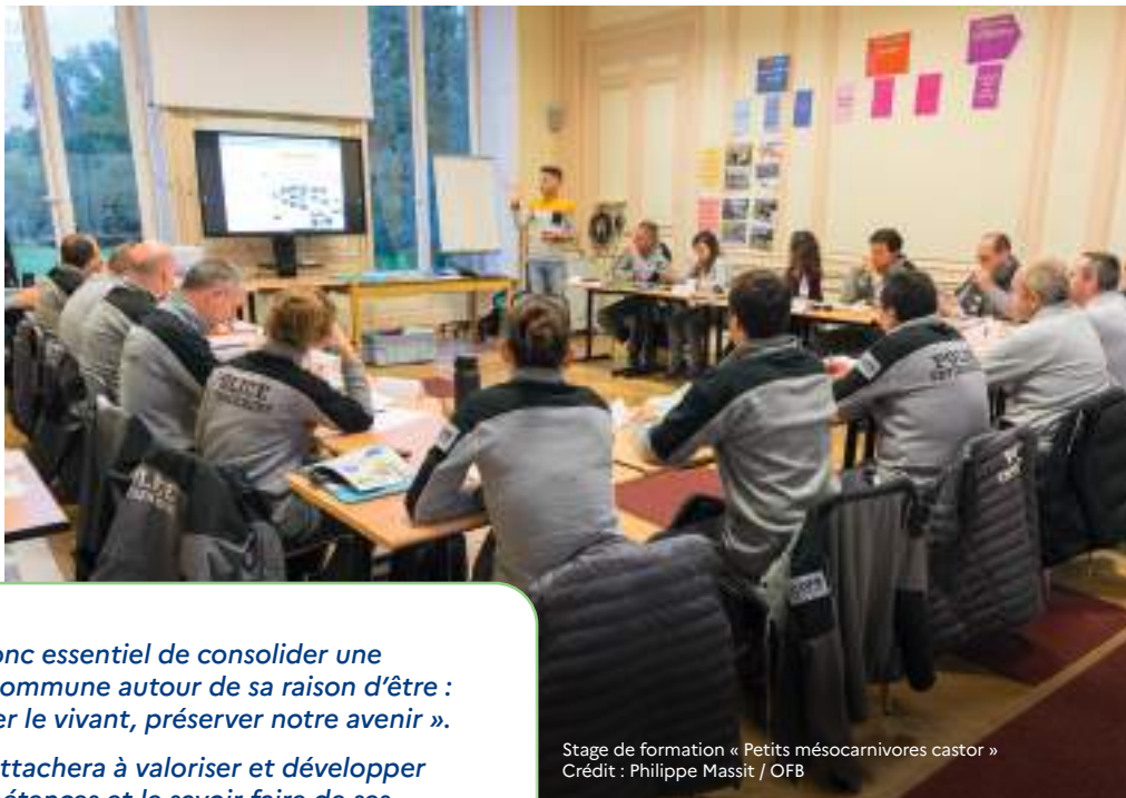
Stage de formation « Petits mésocarnivores castor »

L'OFB est un établissement jeune, qui résulte de fusions successives encore récentes entre différents établissements.