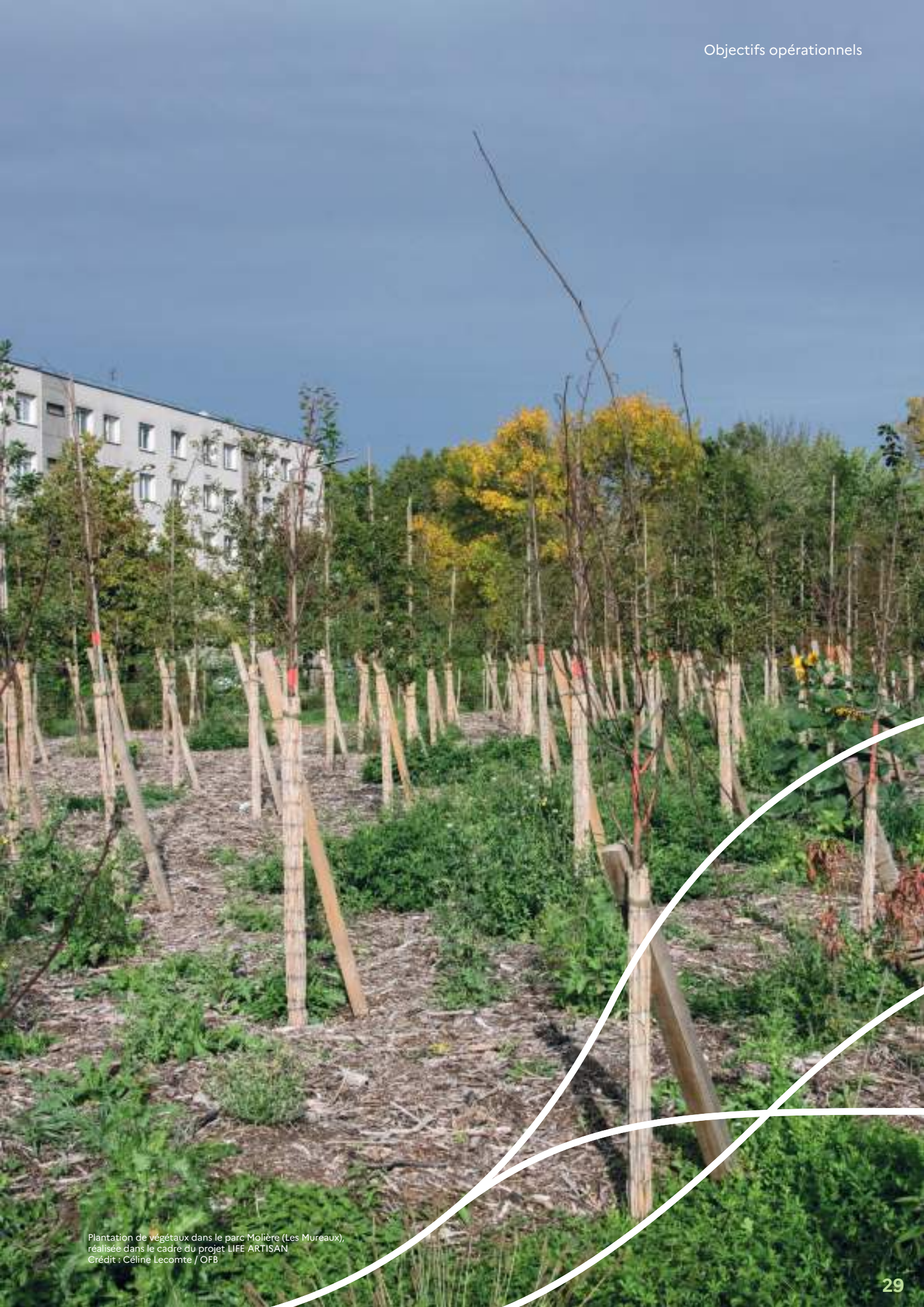
Plantation de végétaux dans le parc Molière (Les Mureaux), réalisée dans le cadre du projet LIFE ARTISAN