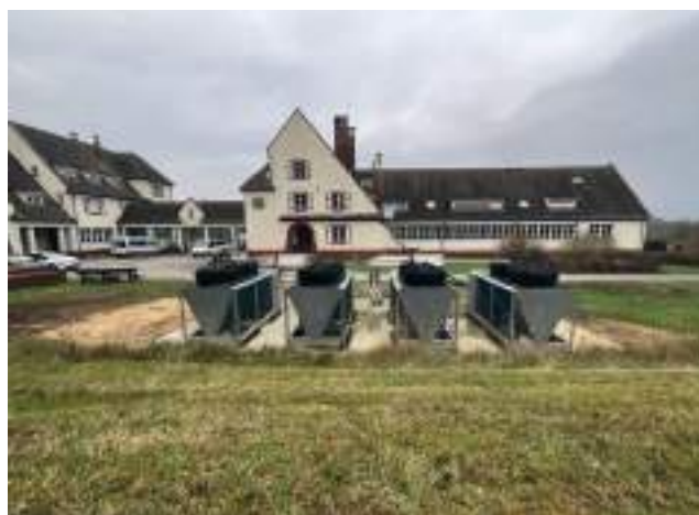
Pompes à chaleur au Centre de formation du Paraclet

Sur le plan du développement durable, il s'agit de poursuivre la mise en œuvre d'une démarche éco-responsable exemplaire impliquant les agents et tenant compte des contraintes spécifiques aux missions, notamment de terrain. Sur la base notamment du bilan des émissions de gaz à effet de serre (BEGES) réalisé en 2025, il s'agit ainsi de mettre en œuvre le plan de transition associé, afin de poursuivre l'amélioration de la performance énergétique et environnementale de l'établissement, de réduire l'empreinte environnementale de ses activités, et de contribuer à l'adaptation au changement climatique et à la restauration de la biodiversité au moyen d'actions concrètes.