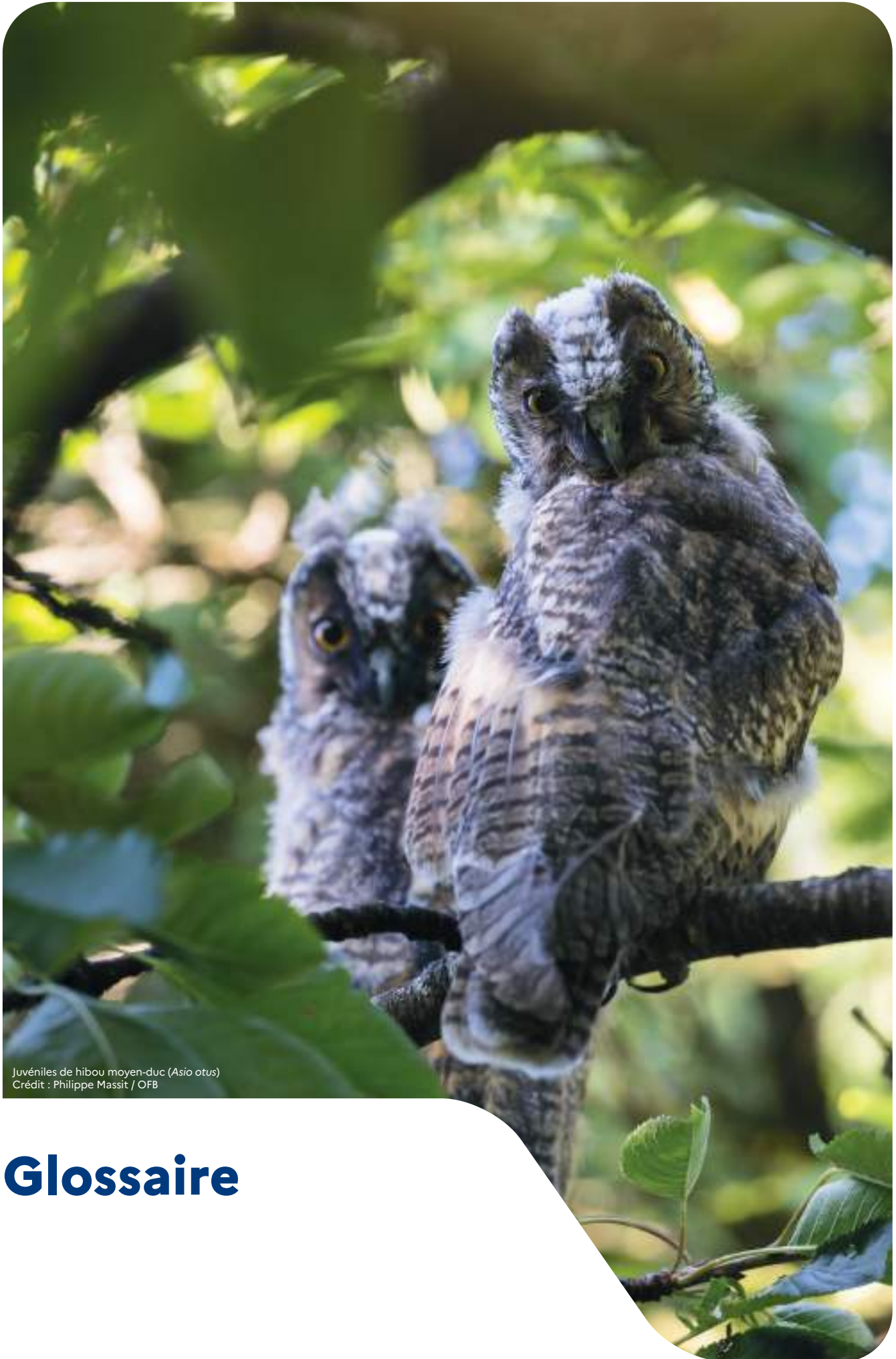
Juveniles de hibou moyen-duc ( Asio otus )