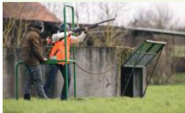
Examen du permis de chasser

L'OFB poursuivra l'organisation des examens du permis de chasser en lien étroit avec les fédérations départementales des chasseurs, pour programmer les sessions d'examen au plus près des besoins et réviser le barème de l'examen en tant que de besoin, notamment au regard des analyses de l'accidentologie. L'OFB continuera de délivrer les permis de chasser, pour les nouveaux chasseurs comme pour les renouvellements, en veillant à la sécurité des titres et à la lutte contre la fraude.