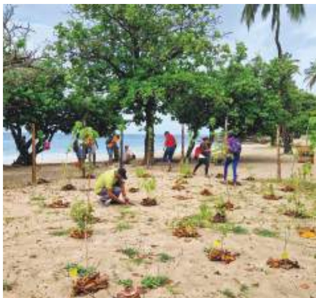
Micro-projet TeMeUm, Martinique – Revégétalisation des plages de Gros-Raisin

À travers son propre programme d'intervention (TeMeUm, Mission Nature) ou différents programmes portés en partenariat (comme Best LIFE 2030), l'OFB contribue à la restauration des milieux naturels, au déploiement de solutions fondées sur la nature, et plus largement à des actions en faveur de la biodiversité portées par des acteurs des territoires ultramarins (associations, acteurs économiques, collectivités territoriales ou autres établissements publics). L'établissement agit en complémentarité avec les ARB ultramarines quand elles existent.