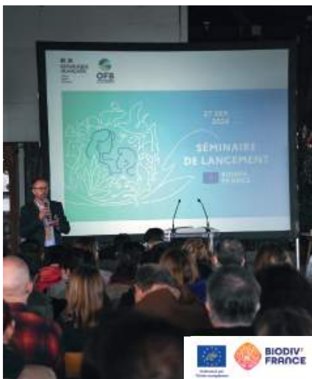
Séminaire de lancement LIFE BIODIV'FRANCE

La stratégie nationale pour la biodiversité (SNB 2030), de par son caractère intégrateur, constitue le cadre de référence principal pour l'OFB, qui veille à apporter des contributions cohérentes et bien articulées à la SNB et aux stratégies et plans d'action connexes ou qui en découlent (stratégie nationale aires protégées, plan national de restauration, plans nationaux plus spécifiques concernant les milieux humides, les prairies ou les espèces exotiques envahissantes...). L'OFB poursuit la conduite du projet LIFE BIODIV'FRANCE qui est conçu pour renforcer l'OFB et les autres bénéficiaires dans la mise en œuvre de la SNB, en veillant au dialogue avec le ministère chargé de l'environnement dans le pilotage du projet.