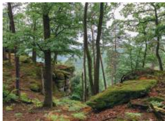
Réserve nationale de chasse et de faune sauvage de la Petite-Pierre

L'objectif de conforter un réseau de réserves exemplaires est poursuivi, en apportant une cohérence à l'échelle du réseau et de l'établissement.