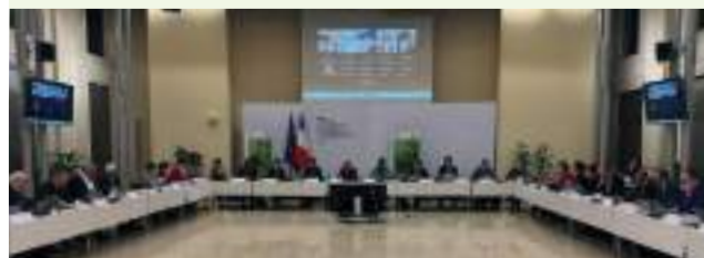
Séance du Conseil d'administration