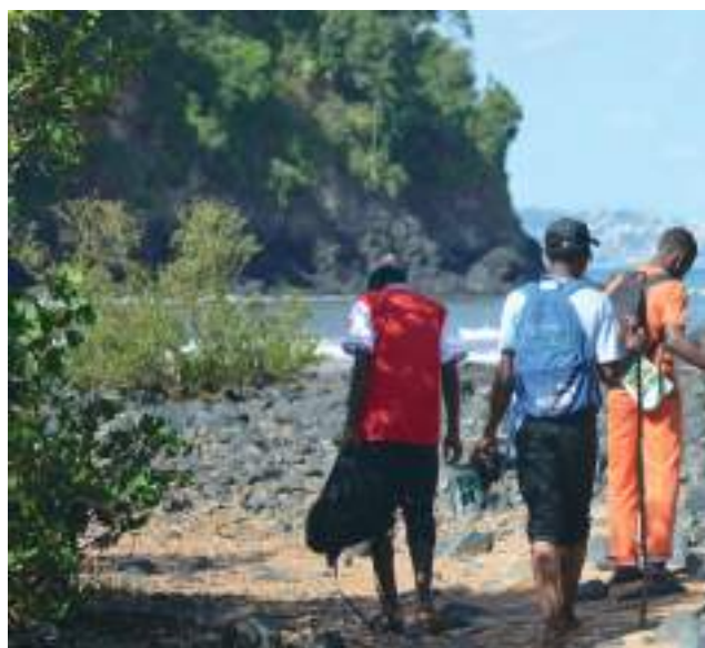
Sortie pédagogique mangrove de Tsingoni

En bonne articulation avec la DEB et en lien avec les préfets compétents pour les aides significatives aux acteurs locaux, l'OFB maintiendra son appui aux associations sur des projets structurants en adéquation avec cet objectif, mais aussi dans son rôle de relais et de mobilisation de la société civile et des corps intermédiaires aux enjeux de préservation de la biodiversité.