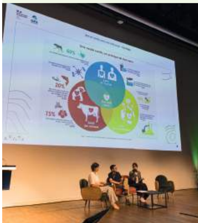
RBT 2025 - Atelier « Concilier santé publique, préservation de la biodiversité et transition alimentaire »

Il s'agit de lancer des démarches de construction de récits prospectifs pour aller vers d'autres représentations de l'avenir intégrant le vivre avec la biodiversité et garantissant l'habitabilité des territoires. Il ne s'agit pas d'imposer des récits mais d'impulser et d'accompagner des démarches collectives de co-construction pouvant faire appel tant à la science et à la connaissance (savoirs locaux, indicateurs quantitatifs, données qualitatives) qu'aux imaginaires, au sensible, aux expériences vécues, notamment via des médiations artistiques et culturelles, autour de concepts tels que ceux de « vie bonne », de santé globale, de résilience, sobriété, solidarité ou de lien social et territorial. La finalité de ces récits est d'enclencher des changements profonds dans les représentations (dont la relation au vivant), les organisations et les pratiques en faveur de la biodiversité et des sociétés humaines, aux échelles locales et nationales.