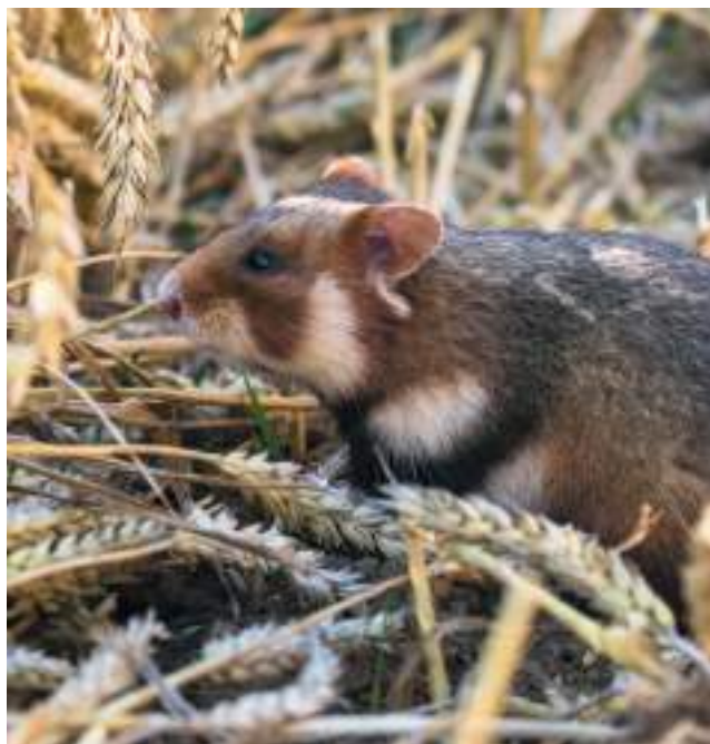
Grand hamster ( Cricetus cricetus )