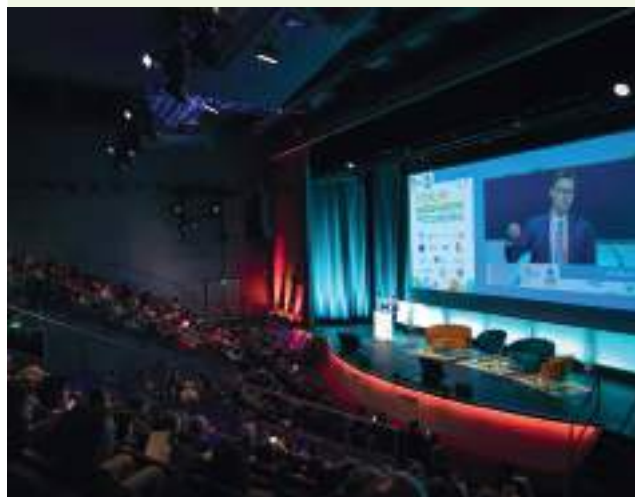
Forum Biodiversité et Économie - Plénière d'ouverture

L'OFB organise tous les deux ans le Forum Biodiversité et Économie. Il réunit les entreprises engagées ou qui souhaitent s'engager pour la biodiversité ainsi que les acteurs qui les accompagnent pour créer des espaces d'échanges et de partage de pratiques, améliorer leurs connaissances et appropriation des outils et initiatives, ainsi que des synergies pour susciter de nouveaux engagements. Tout au long de l'année, l'OFB organise ou participe à des temps de sensibilisation et de formation sur les enjeux biodiversité.