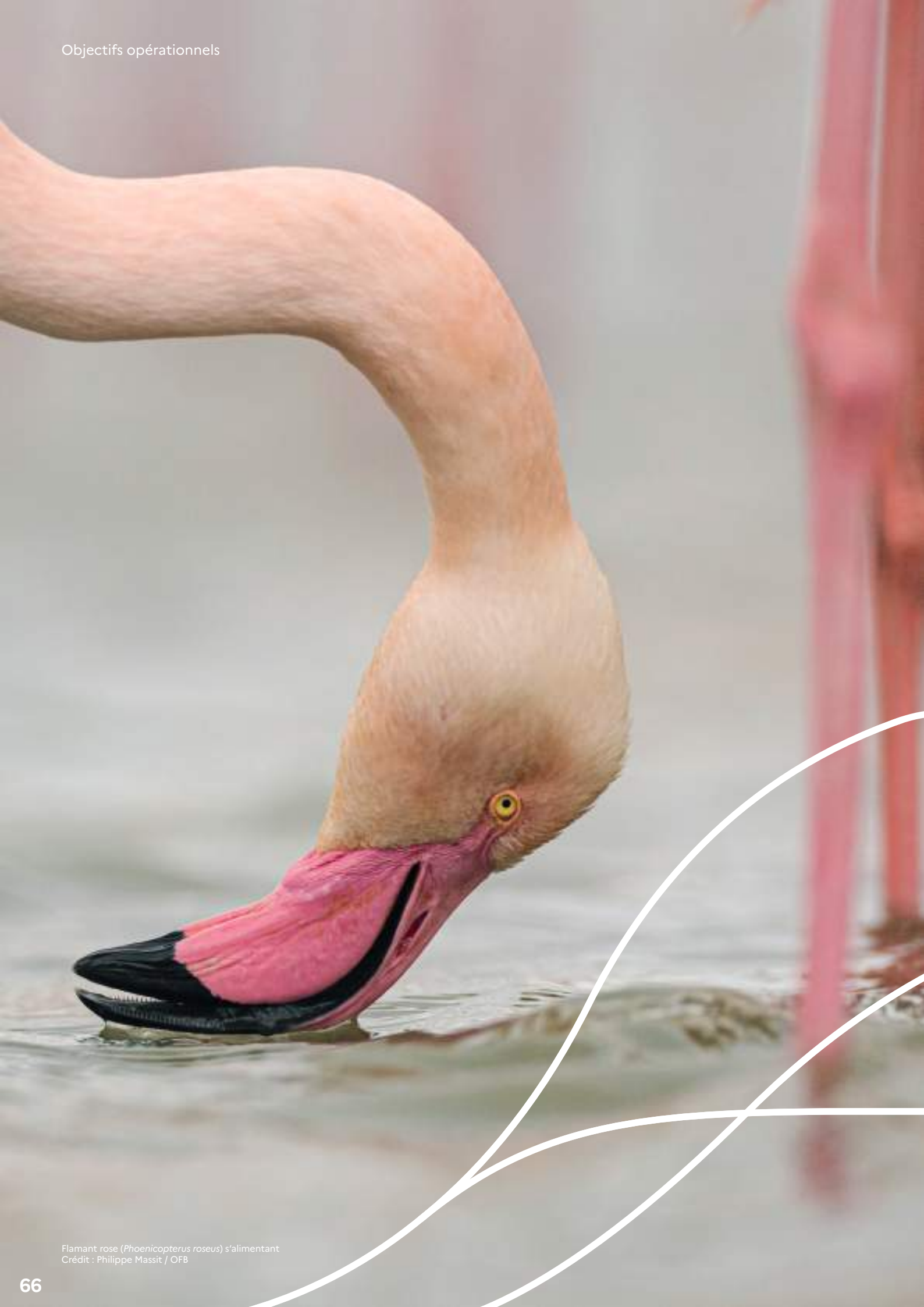
Flamant rose ( Phoenicopterus roseus ) s'alimentant