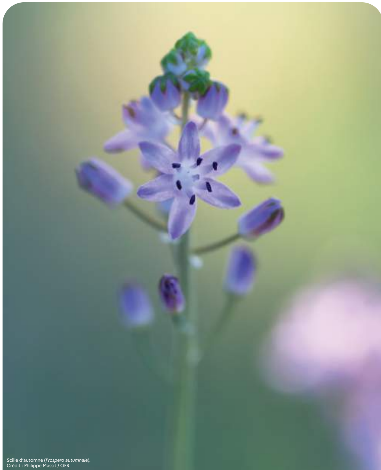
Scille d'automne ( Prospero autumnale ).