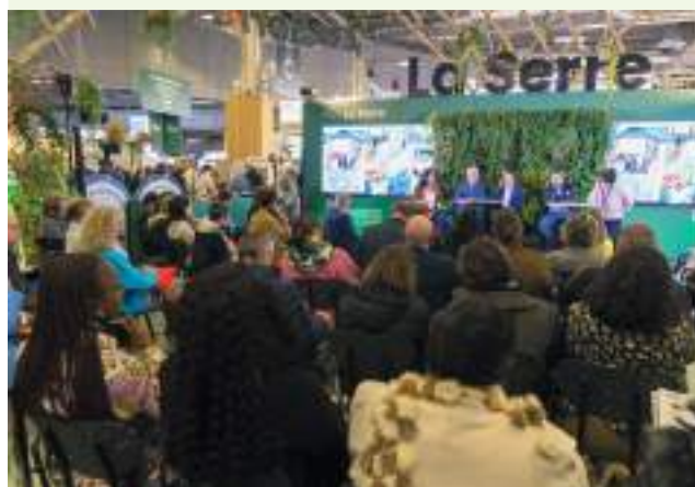
Table ronde sur les solutions fondées sur la nature au Salon des Maires

Enfin, l'OFB s'engage pleinement dans le collectif autour des Agences régionales de la biodiversité (ARB).