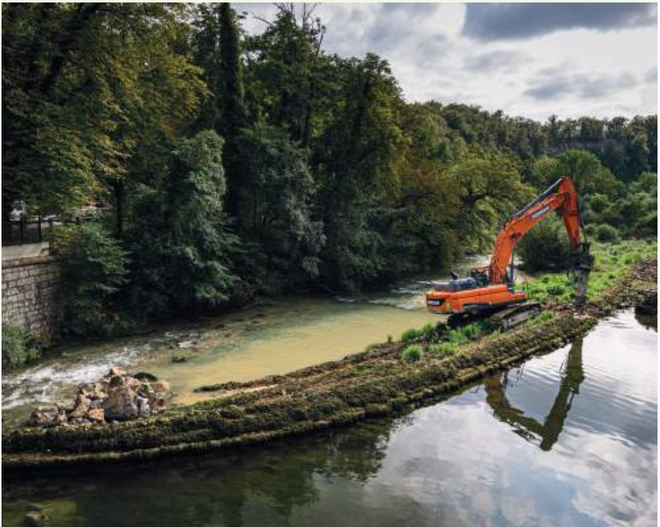
Chantier de dérasement du barrage des Pipes

climatiques et bénéfiques environnementaux et socio-économiques des solutions fondées sur la nature (SFN), pour élargir le public touché. Enfin l'OFB renforce les partenariats avec les établissements publics investis sur l'adaptation (Cerema, ADEME, Conservatoire du littoral, Agences de l'eau, etc.) pour favoriser l'intégration des enjeux de biodiversité et des SFN dans leurs travaux.