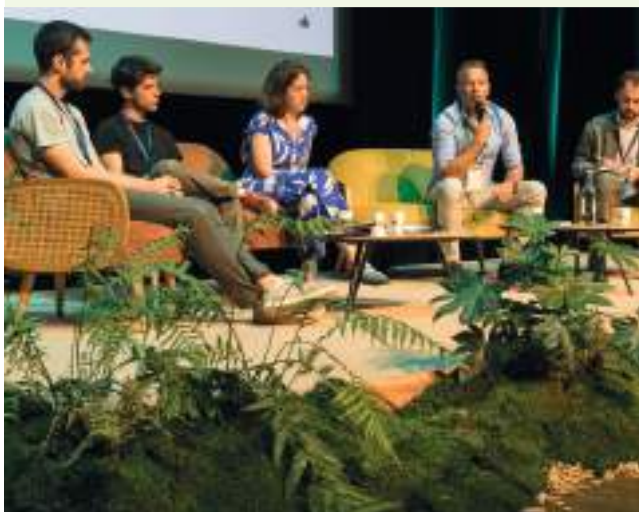
Rencontres biodiversité et territoires - Atelier « Encourager l'engagement commun »

Le programme Entreprises engagées pour la nature (EEN) piloté et déployé par l'OFB vise à mobiliser, fédérer et accompagner les entreprises dans la mise en œuvre de démarches biodiversité opérationnelles et robustes. Il sera recherché une démultiplication et une massification des engagements volontaires qui s'appuiera notamment sur des partenariats avec des initiatives existantes mais aussi la territorialisation de l'animation du programme via les Agences régionales de la biodiversité (ARB).