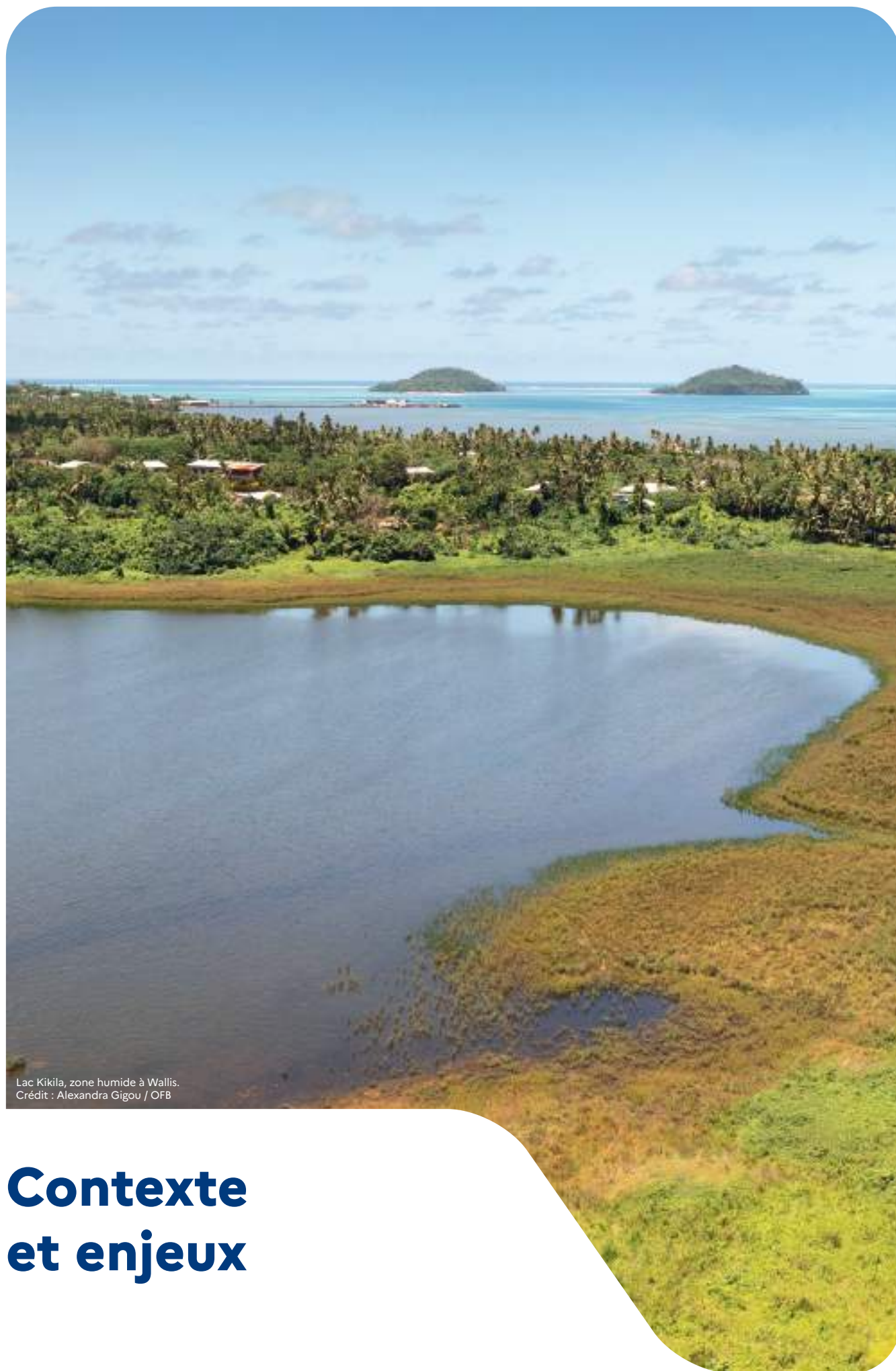
Lac Kikila, zone humide à Wallis.