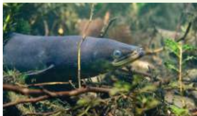
Anguille d'Europe ( Anguilla anguilla )

Renforcer l'animation et l'accompagnement des producteurs de données sur le patrimoine naturel, les outiller (participer à la montée en puissance de GéoNature et à sa robustesse), faire évoluer le SINP en vue d'améliorer les flux de données.