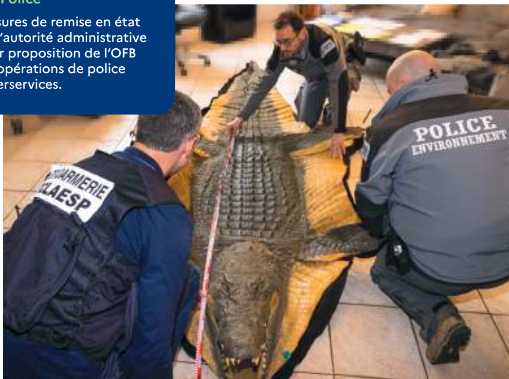
Opération de police conjointe entre l'Office central de lutte contre les atteintes à l'environnement et à la santé publique (OCLAESP) de la gendarmerie nationale et l'OFB.

Nombre de mesures de remise en état prononcées par l'autorité administrative ou judiciaire sur proposition de l'OFB et nombre d'opérations de police interservices.