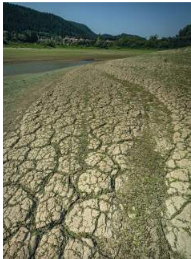
Étiage sévère dans le Haut-Doubs

La France est pleinement et largement concernée par ces questions, à la fois parce qu'elle est touchée par les conséquences de l'effondrement de la biodiversité et parce que, avec ses écosystèmes hexagonaux et ultramarins, elle détient une importante responsabilité au plan international (seul pays présent dans 5 des 25 points chauds de la biodiversité mondiale (Méditerranée, Caraïbes, Océan Indien, Nouvelle-Calédonie, Polynésie) et dans 1 des 3 zones forestières majeures de la planète (Amazonie), 2 e domaine maritime du monde, etc.). Elle détient aussi une responsabilité importante du fait du poids de son économie et de son influence internationale.