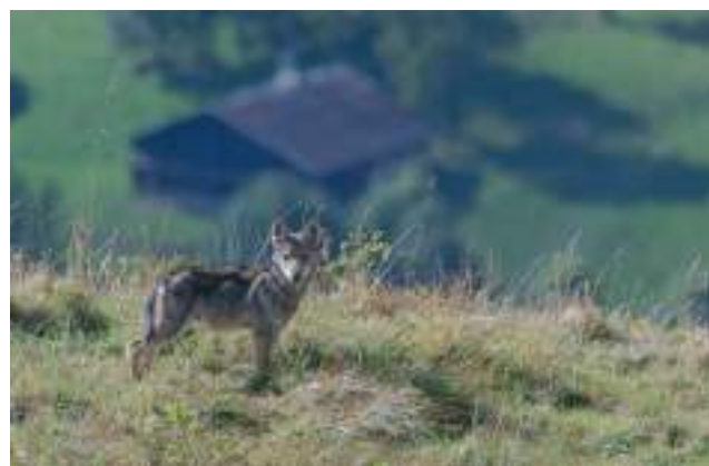
Louveteau ( Canis lupus )

L'OFB poursuivra ses actions de connaissance, d'accompagnement et de prévention, s'agissant des grands pré-