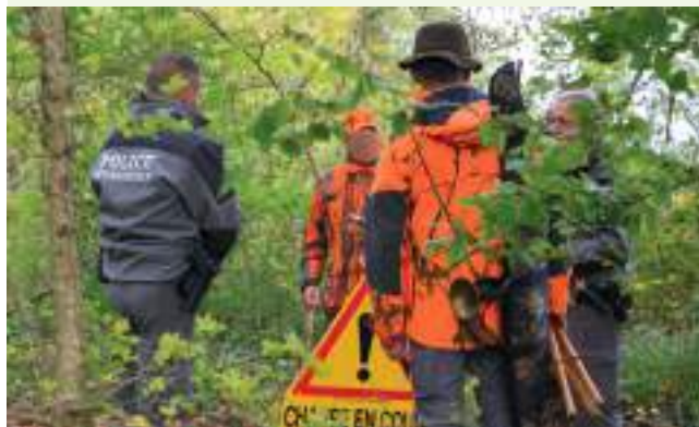
Opération de contrôle de sécurité à la chasse

L'OFB portera une attention particulière à la police de la chasse, pour assurer la sécurité des chasseurs et des non chasseurs et contribuer à une chasse durable. L'accent restera mis, conformément à la stratégie nationale de contrôle, sur la sécurité à la chasse comme sur les espèces à enjeux (espèces soumises à gestion adaptative ou à un prélèvement maximal autorisé par exemple), dans le but de garantir une chasse durablement compatible avec le maintien des populations.