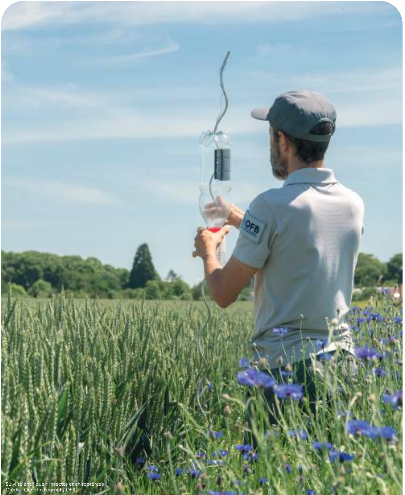
Suivi scientifique « insectes et chiroptères »