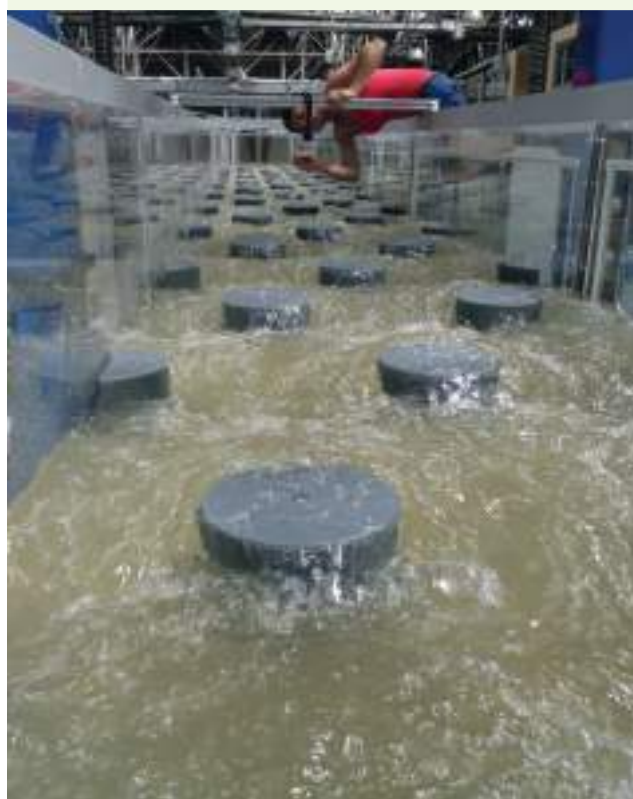
Mesures hydrauliques dans un modèle réduit de passe à poissons (pôle Eco-hydraulique)

Dans un contexte marqué par les révisions récentes des textes dans le domaine de l'eau et par un intérêt croissant des pouvoirs publics sur l'amélioration de la connaissance de la qualité de l'eau et des sources de pollutions, les objectifs portent notamment sur la caractérisation des différentes sources polluantes, l'identification des composés d'intérêt émergent, la connaissance des niveaux et voies d'exposition et de transfert, et des effets des pollutions, notamment chimiques, sur les milieux et le vivant.