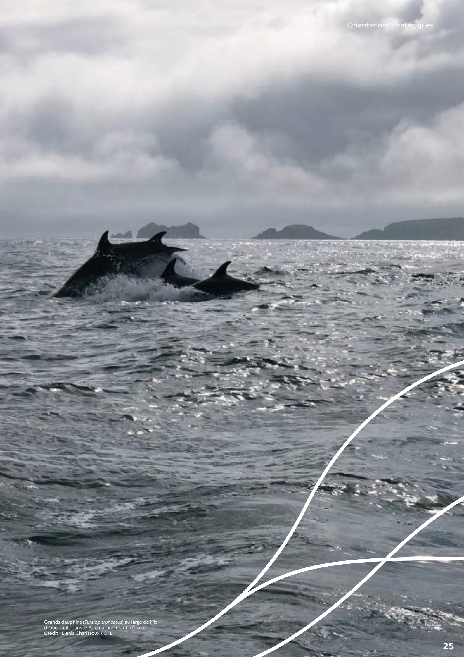
Grands dauphins ( Tursiops truncatus ) au large de l'île d'Ouessant, dans le Parc naturel marin d'Iroise