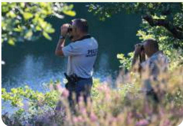
Inspecteurs de l'environnement en mission de police

90 services départementaux et 2 services interdépartementaux dans l'Hexagone