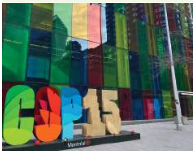
15 e conférence des Parties (COP15) à la Convention sur la diversité biologique - Montréal

Conformément à la mission confiée à l'OFB par sa loi de création, l'Établissement apporte un appui dans la préparation et le cas échéant pendant les négociations européennes et internationales. Cet appui peut passer par la mise à disposition d'expertise ou par la réalisation de travaux permettant de préparer ou d'étayer les positions françaises.