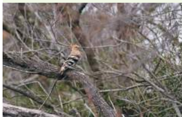
Huppe fasciée ( Upupa epops ), site des Grandes Cabanes du Vaccarès Sud, espace naturel protégé

Grâce à ces territoires, l'OFB développe l'expérimentation au niveau des pratiques agricoles, sylvicoles, piscicoles et cynégétiques, en tenant compte du changement climatique, ainsi que la connaissance et la recherche sur la biodiversité présente sur ces domaines. Il met en œuvre, en régie ou avec des relais et appuis extérieurs, les actions de gestion des domaines nécessaires à leur mise en valeur, notamment au travers de plans de gestion, et évalue les effets de la gestion menée sur les domaines au niveau économique et biodiversité, ainsi que son efficacité.