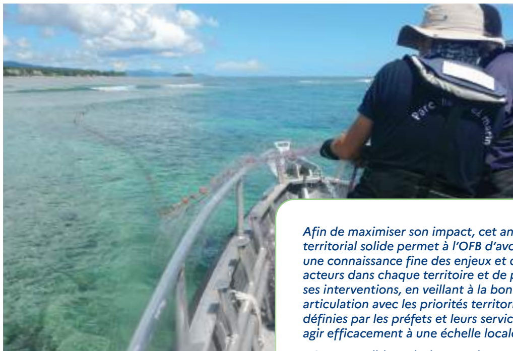
Opération de police des pêches dans le lagon du parc naturel marin de Mayotte

L'OFB est implanté dans les territoires. Sur les 3 000 agents de l'établissement, une grande majorité est répartie dans les entités territoriales, dans l'Hexagone et dans les Outre-mer, à l'échelle nationale, régionale et départementale. Ces agents exercent des missions de police de l'environnement, contribuent à la mise en œuvre de la séquence « Éviter, Réduire, Compenser » avec une attention toute particulière sur la phase d'évitement des impacts sur la biodiversité, assurent la surveillance des écosystèmes, des fonctions et services écosystémiques et des pressions qui s'y exercent, contribuent à la recherche, gèrent des aires protégées (8 parcs naturels marins et une trentaine de réserves), accompagnent les autres gestionnaires d'aires protégées, appuient et conseillent les collectivités et autres acteurs territoriaux, interagissent avec les citoyens, contribuent à certains outils de planification territoriale et à la mise en œuvre sur le terrain des stratégies nationales, participent à des projets d'éducation à l'environnement et veillent aux enjeux et missions cynégétiques auprès des fédérations de chasse (police de la chasse, examen du permis de chasser).