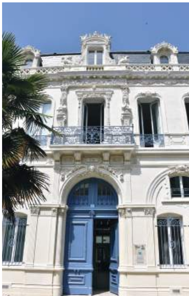
Façade de l'ancienne trésorerie de Rochefort, rénovée grâce au plan France Relance, et hébergeant désormais le Parc naturel marin de l'estuaire de la Gironde et de la mer des Pertuis, le service départemental de Charente-maritime, et une partie de la brigade mobile d'intervention sud-ouest.