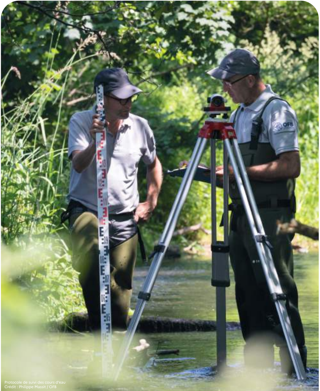
Protocole de suivi des cours d'eau