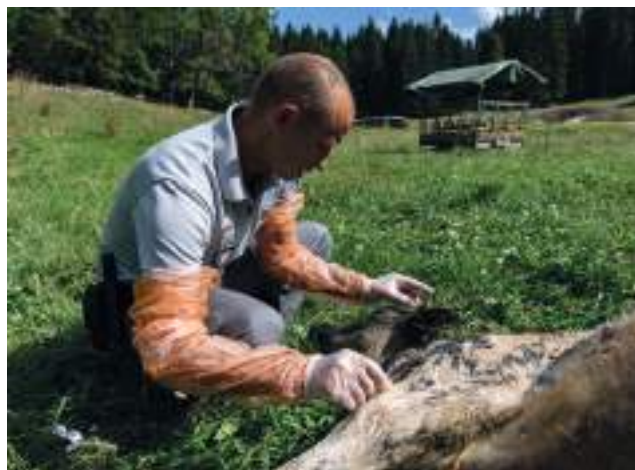
Constat de dommage d'une attaque de loup

Dans les autres sites gérés en propre, l'établissement s'engage dans un processus d'une plus grande ouverture au public compatible avec les enjeux écologiques, en y organisant notamment des événements conviant les élus et les acteurs locaux. Dans l'ensemble, l'OFB s'appuie sur les reconnaissances internationales à développer (catégorisation UICN, Patrimoine Unesco, désignation Ramsar, Réserve de biosphère, Liste verte, etc.) pour une plus forte valorisation des sites et des acteurs concernés.