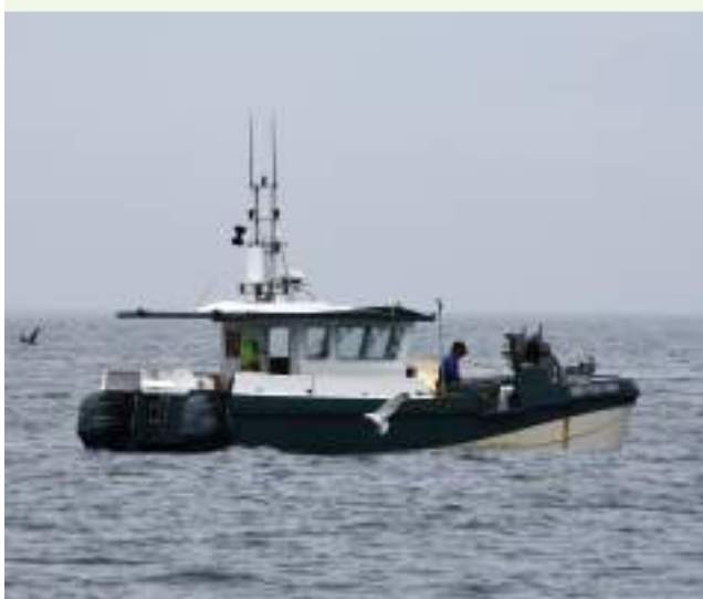
Puffin des anglais et goéland autour d'un petit fileyeur

Plus indirectement, l'OFB soutient des travaux sur des scénarios reliant les enjeux de biodiversité et des enjeux sectoriels. Il appuie la conception ou l'évaluation des labels ou de l'affichage environnemental.